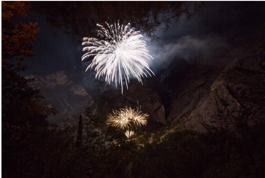
Le Gole di Fara S. Martino nel Parco Nazionale della Majella ed i fuochi di artificio